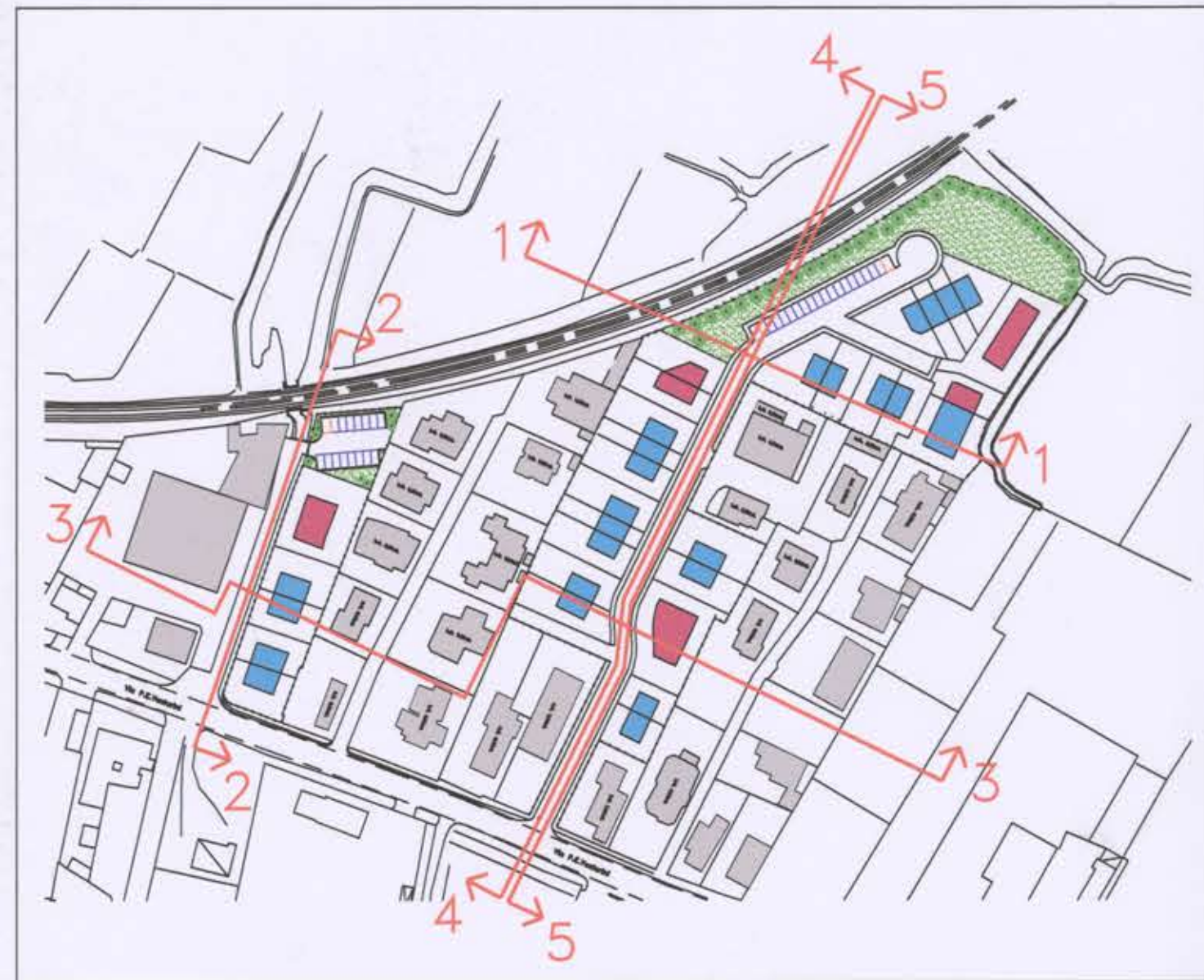
SCHEMA SEZIONI scala 1:2000