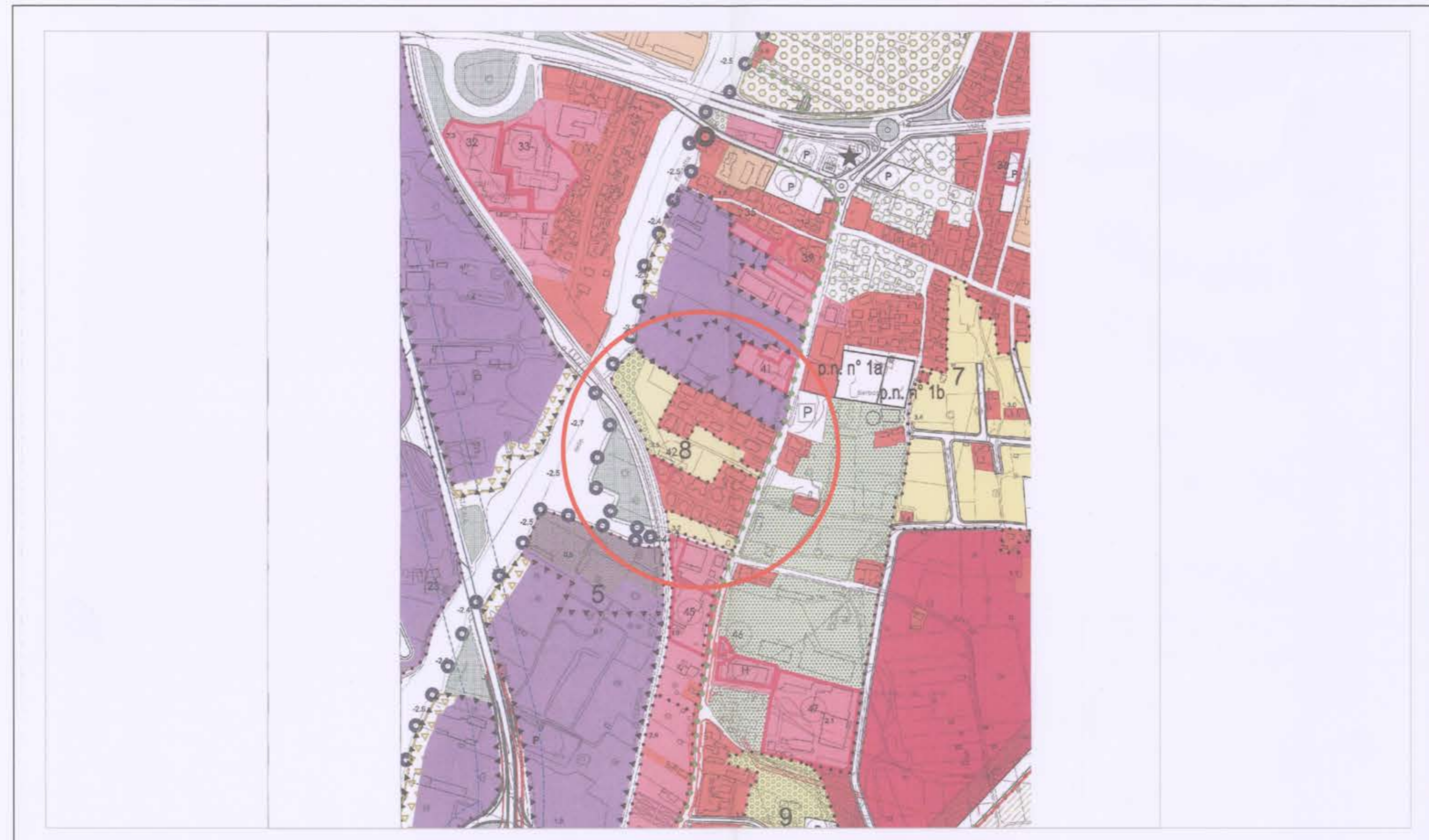
ESTRATTO DI PRG