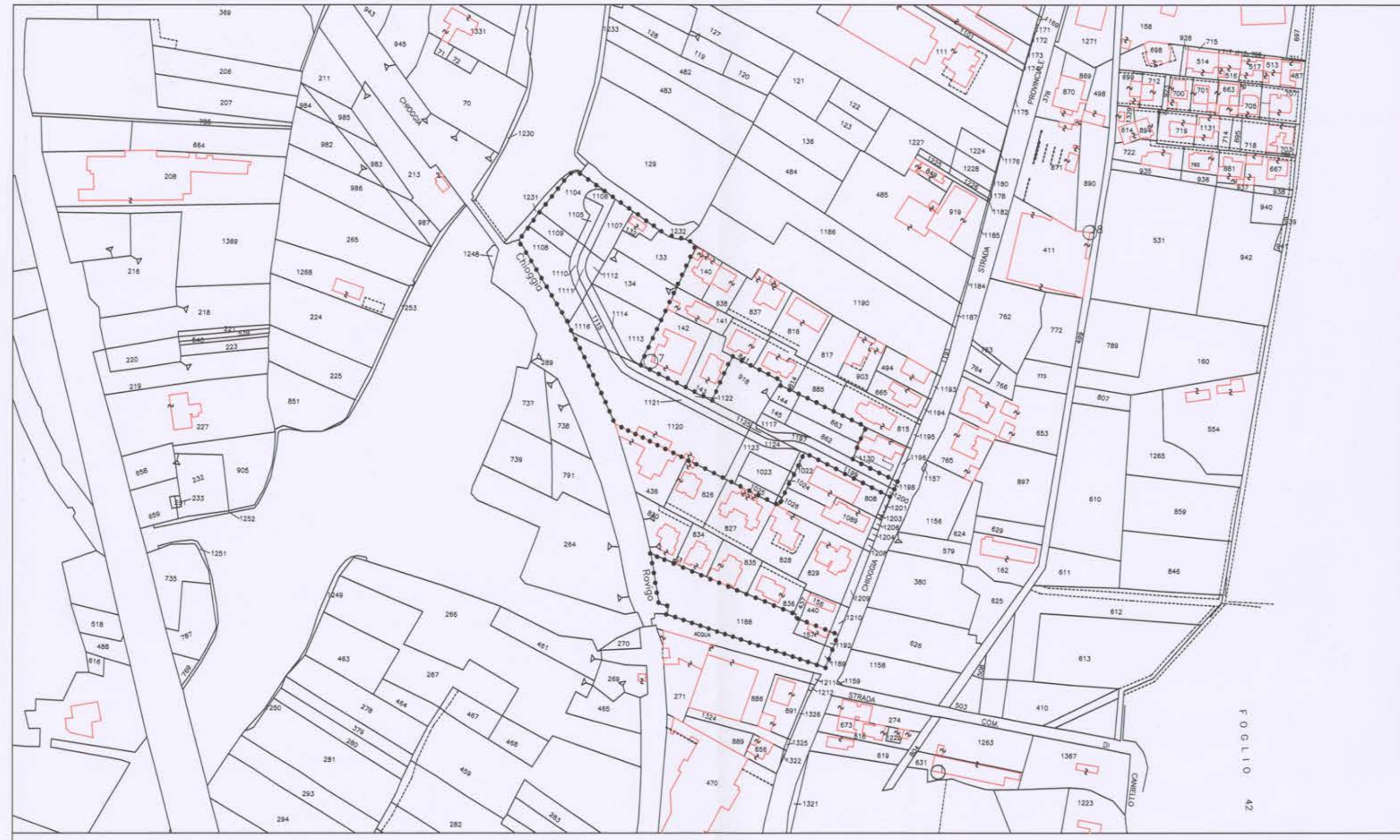
ESTRATTO DI MAPPA N.C.T. e AREA DI INTERVENTO