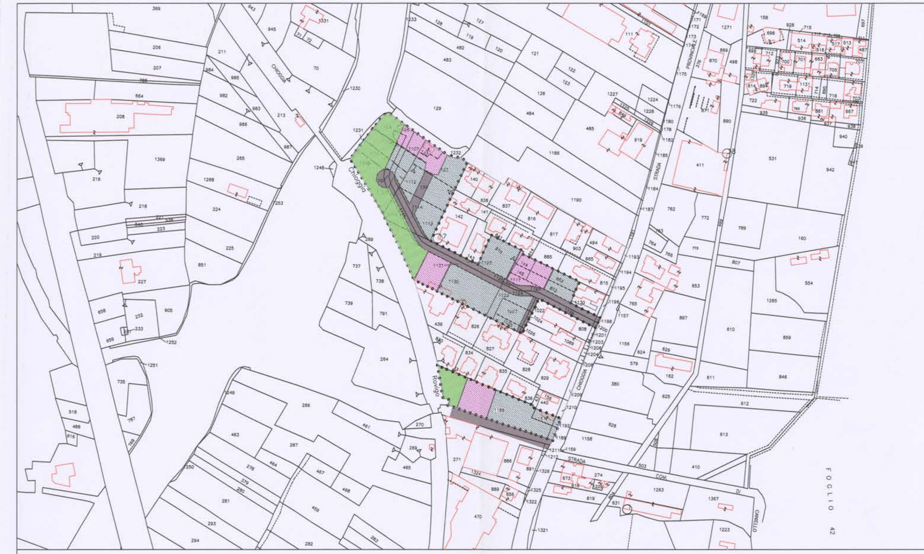
DELIMITAZIONE EDILIZIA PRIVATA E CONVENZIONATA