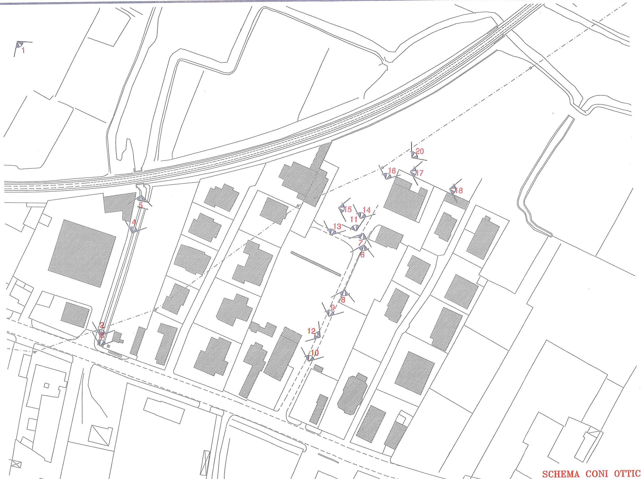
SCHEMA CONI OTTICI Scala 1:1000

A handwritten signature and a circular official stamp are located in the bottom right corner of the drawing.